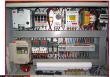
Retourneur souffleur par pincement et son armoire électrique