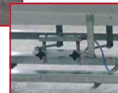
Système de soufflage réglable en hauteur