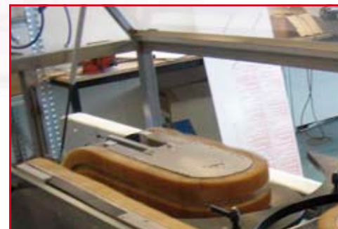
Structure en inox avec cartérisation plexiglass