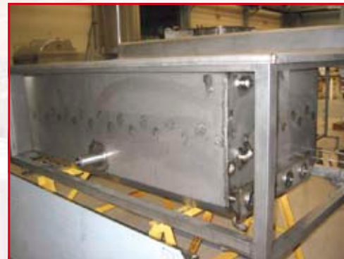
4 thermoplongeurs de 12 KW chacun Châssis tubulaire section 60 x 60 mm Vérins de mise à niveau inox Vidange par vanne inox