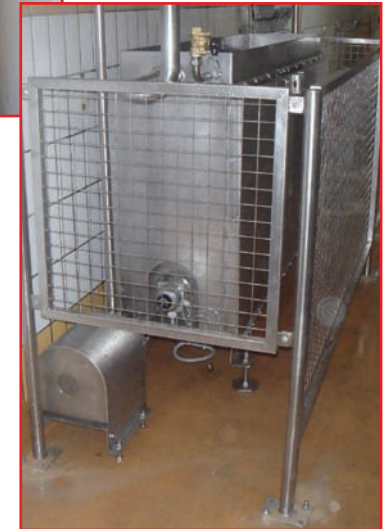
Bac de préparation des solutions de lavage et rinçage Collecteurs d'envoi et de retour