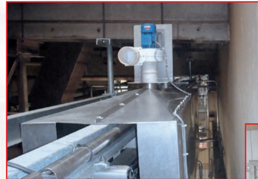
Hotte d'aspiration et son extracteur