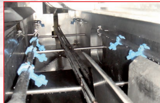
2 rampes de nettoyage : lavage et rinçage équipées de buses à jets plats orientables Goulotte inox pour canalisation des eaux de lavage et de rinçage